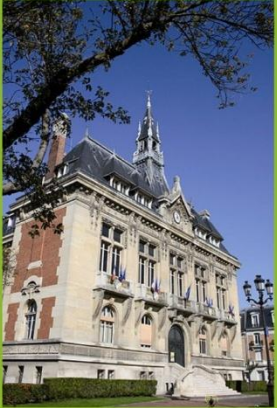
Mairie de Raincy (93)