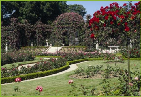
Roseraie de l'Hay-les-Roses (94)